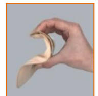
Fleksibelt og diskret