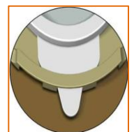
"Nøgle og lås"